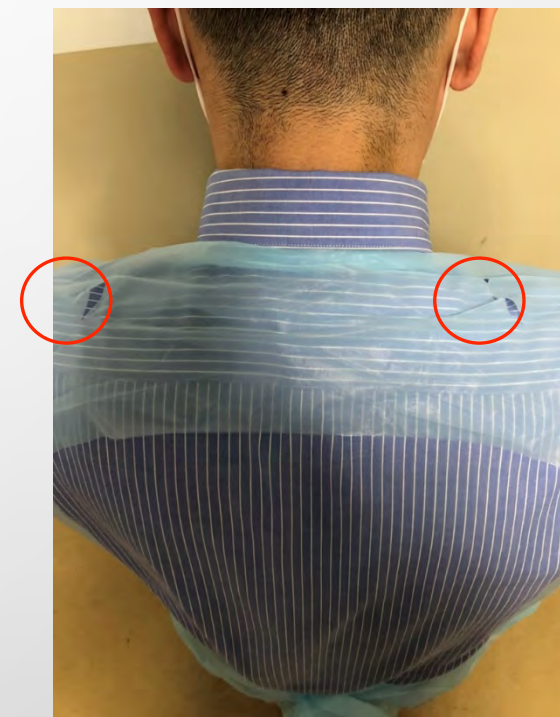
○の部分は切れ込みがあり 前に引っ張る事で引き裂いて 脱ぎやすくなっております。