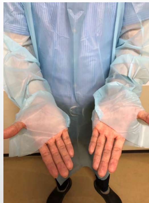
親指を通して袖を固定