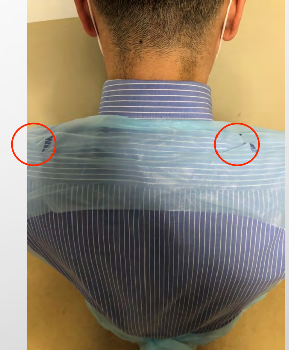
○の部分は切れ込みがあり前に引っ張る事で引き裂いて脱ぎやすくなっております。